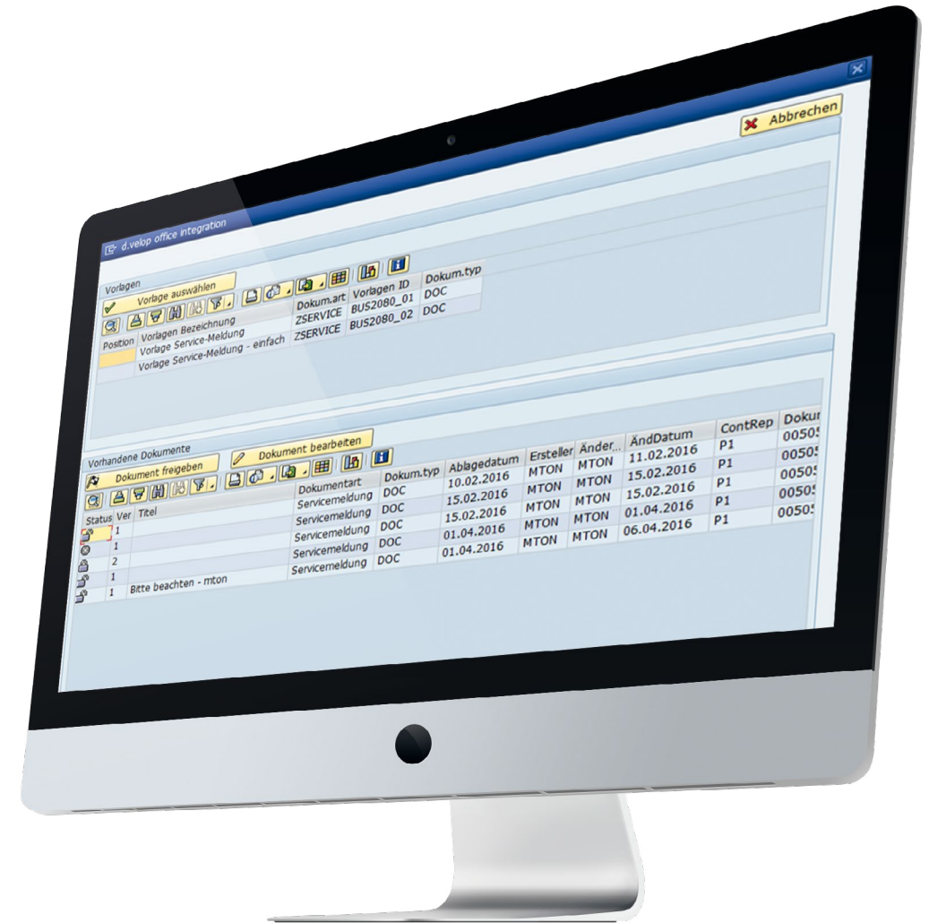
Alle Vorlagen gesammelt an einem Ort per Knopfdruck zu erreichen.

Für weitere Fragen stehen wir Ihnen gerne zur Verfügung. Greifen Sie hierbei auf eine nachhaltige und praxisorientierte Beratung durch unsere Fachkräfte zurück. Sprechen Sie uns einfach an, denn ein echtes Team besteht aus Menschen.