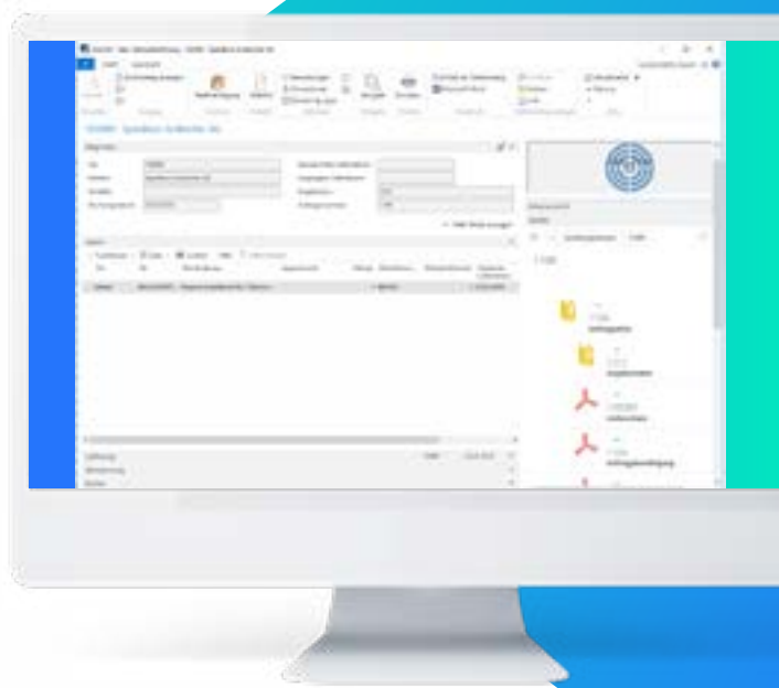
gestione documentale integrata in Microsoft Dynamics NAV – con d.3one.

Dal momento che le fatture sono state scansionate nell'archivio d.velop, non importa se d.3ecm o ecspan, viene garantito che i dati verranno archiviati in conformità alla revisione contabile e in modo sicuro. Ovviamente è garantito anche il rispetto dei periodi di conservazione e le fruibilità delle informazioni per eventuali revisori.