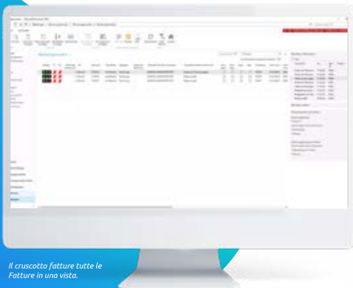
Il cruscotto fatture tutte le Fatture in una vista.

Grazie ai punti da 1 a 4 otterrete un discreto risparmio di tempo. Questo sicuramente è utile per la vostra azienda. Mantenere le scadenze permette di ottenere sconti e di usufruire quindi regolarmente di questo vantaggio sui costi. Grazie alle funzioni di promemoria è possibile evitare che le fatture rimangano in sospeso e ci si protegge dalle spese di sollecito o dagli interessi di mora.