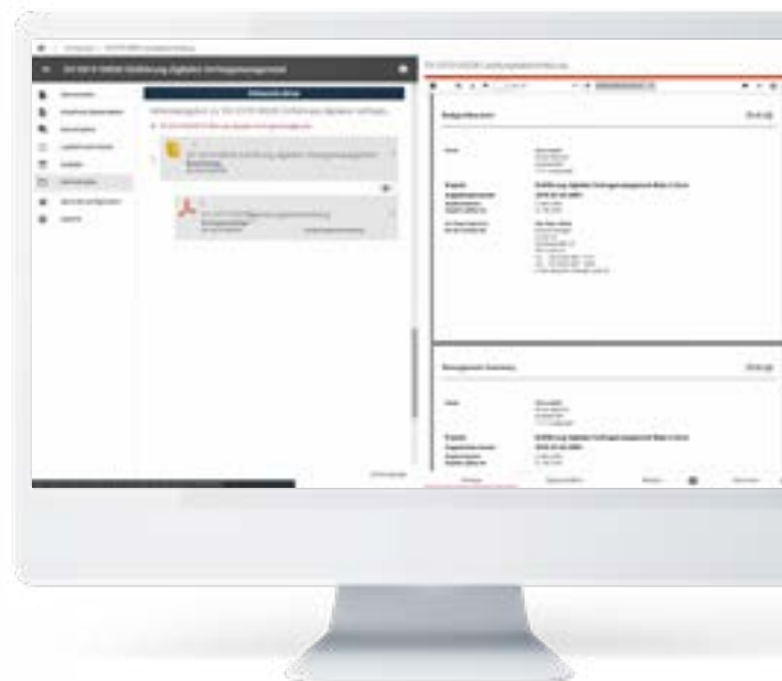
Vertragsübersicht mit relevanten Dokumenten.

Mit dem Vertragsmanagement schaffen Sie die Transparenz, die Sie benötigen, um Ihre Chancen zu nutzen und Ihre Risiken zu minimieren – das Erfolgsrezept für Ihr Vertragsmanagement.